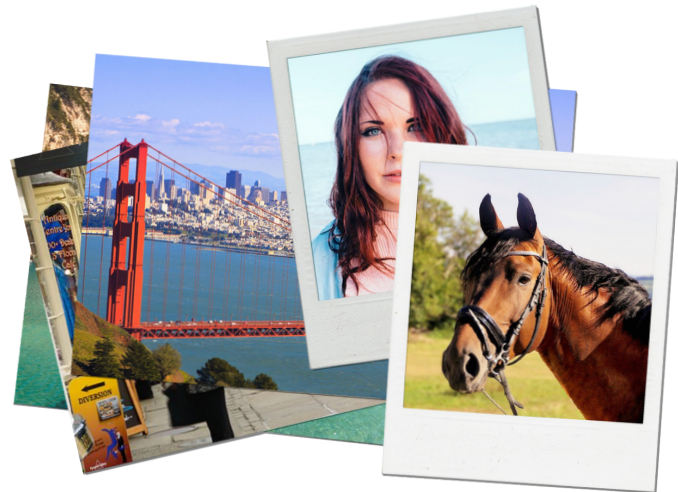
Fotokopior (kallas även papperskopior och påsiktsoriginal) samt Polariodkort. Max: 215 × 900 mm och min: 55 × 75 mm.