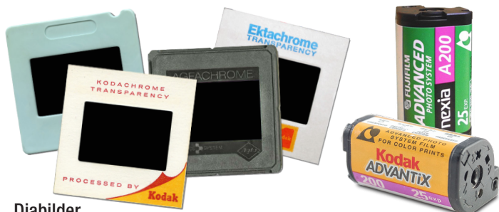
Diabilder med ramstorlek 50 × 50 mm.

DiaDirekt har valt att specialisera sig på de vanligast förekommande analoga stillbildaformaten. De skannars vi använder är bland de bästa som tillverkats för dessa typer av bilder. Det är en av anledningarna till att vi kan hålla så låga priser – eftersom vi inte köpt in dyr utrustning som sällan används, men vars kostnad ändå hamnar på kundens räkning.