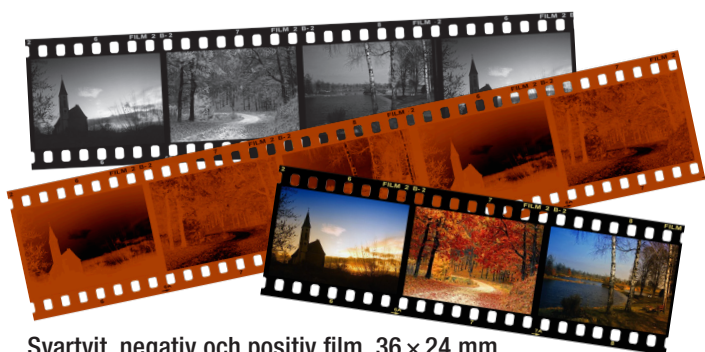
Svartvit, negativ och positiv film, 36 × 24 mm, kallas även småbildaformat, 135-film och 35 mm film.